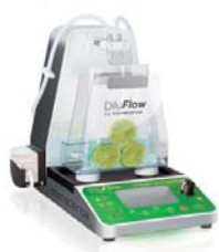
DiluFlow®グラビメトリック自動希釈装置