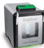
BagMixer®ラボ用ホモジナイザー